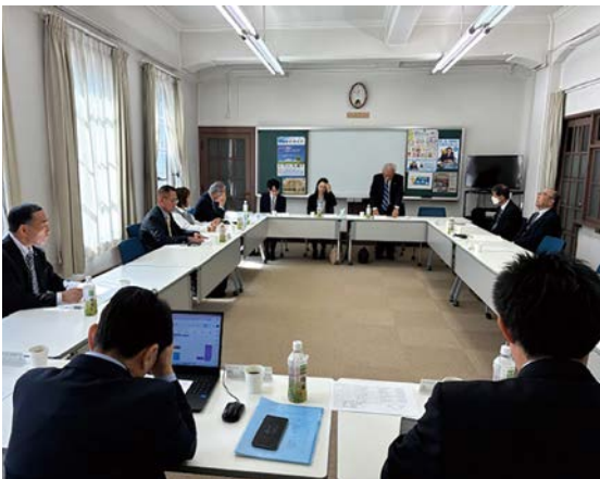
三月十七日(火) 甲府法人会館 県連総務委員会