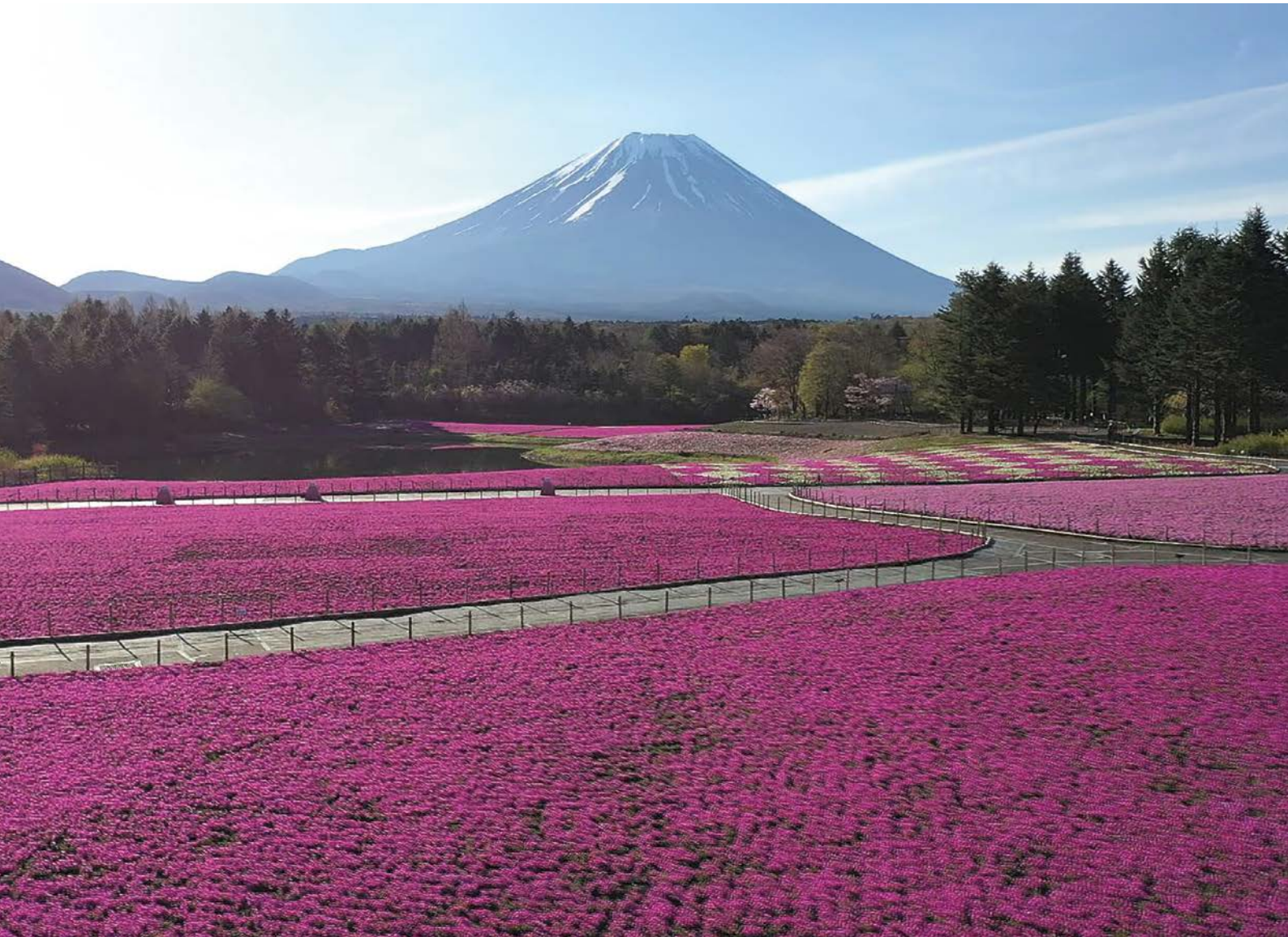
▲富士芝桜と富士山(本栖湖)