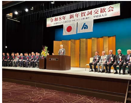
一月十五日(木) 甲府記念日ホテル 県連新年賀詞交歓会