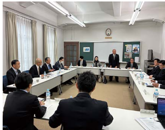
二月二十五日(水) 甲府法人会館 県連税制委員会