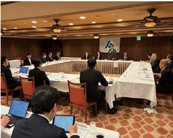
三月十一日(水) ベルクラシック甲府 県連組織・厚生委員会