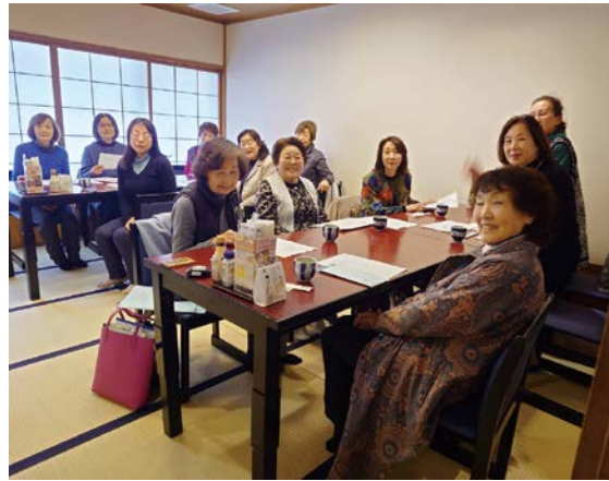
コース部税務研修会・総会 三月十一日(水) 藍屋