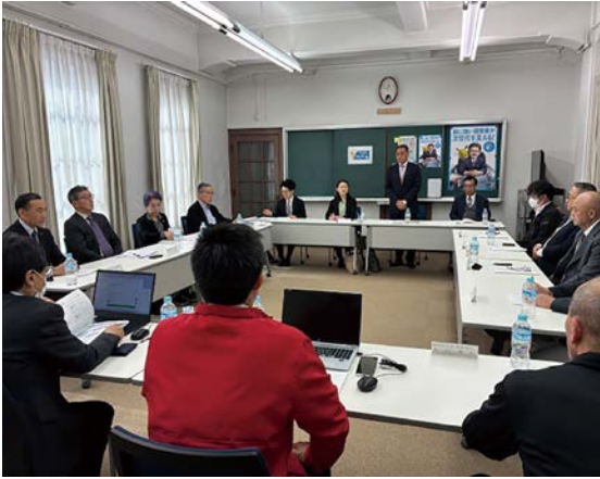
二月二十七日(金) 甲府法人会館 県連広報委員会