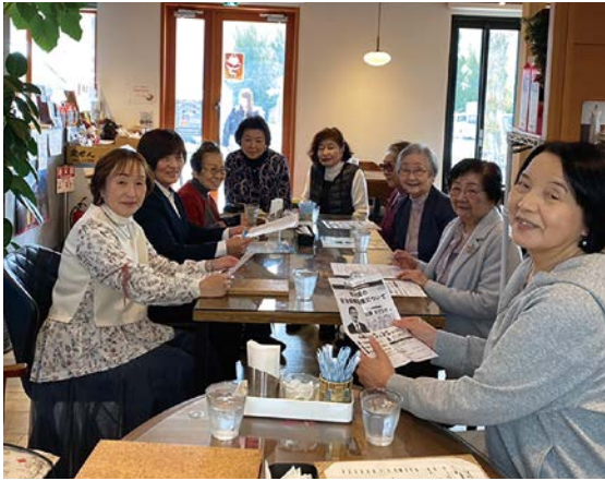
富士吉田支部役員会 三月二十三日(月) ひだまり珈琲