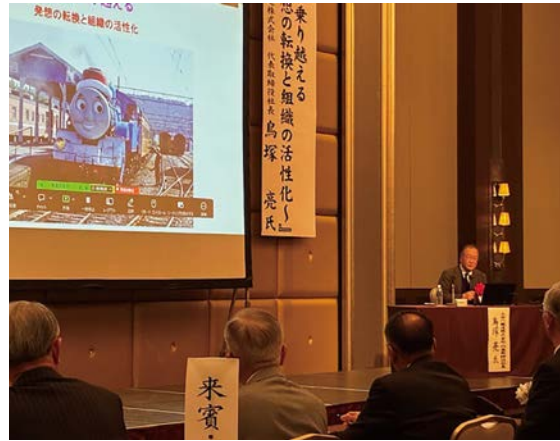
一月十五日(木) 甲府記念日ホテル 県連新春講演会