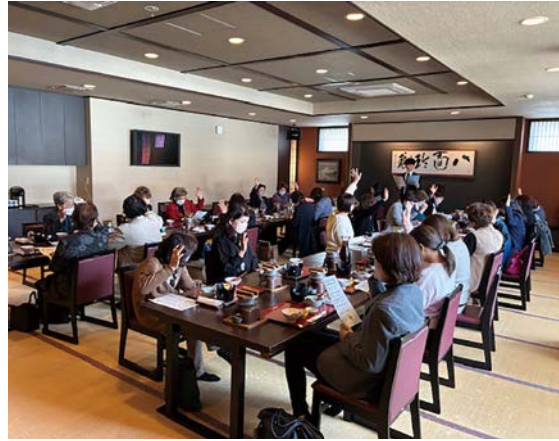
上野原大月都留支部合同税務研修会 三月二日(月) 濱野屋