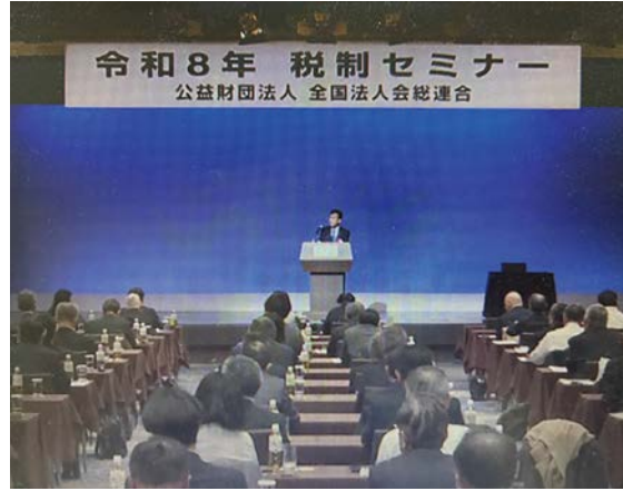
二月十六日(月) リモート出席 全法連税制セミナー