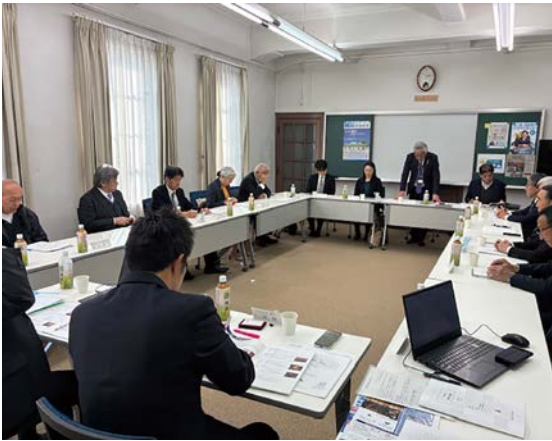
三月九日(月) 甲府法人会館 県連研修委員会