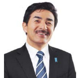
前参議院議員 佐藤 まさひさ 氏